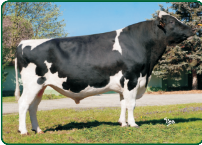
Genos Image ET