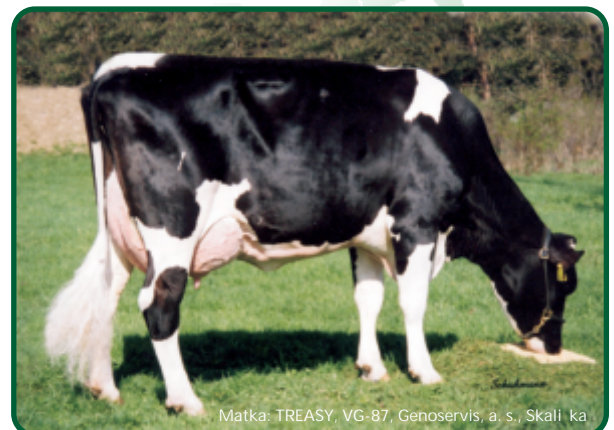
Matka: TREASY, VG-87, Genoservis, a. s., Skali ka